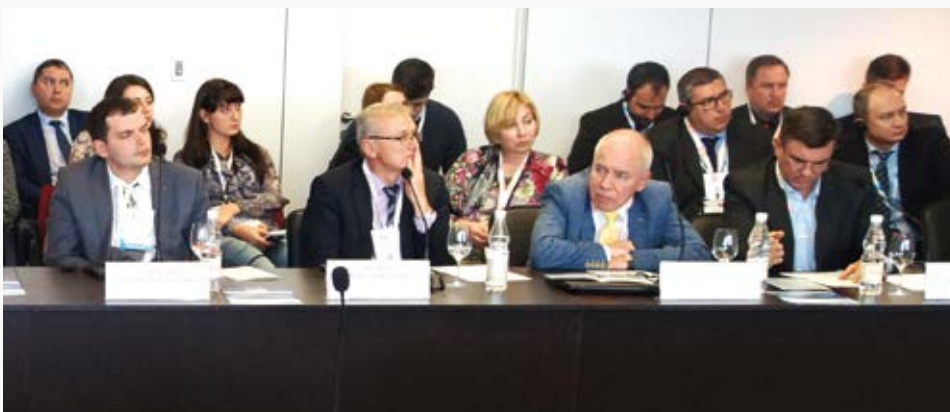
Участники Межотраслевой экспертной сессии

Со своей стороны ПАО «Газпром» пообещал включить продукцию некоторых арматуростроительных компаний, представленных на экспертной сессии, в перечень рекомендуемых при формировании предложений по комплектации объектов корпорации. «Однако мы не имеем право лоббировать интере-