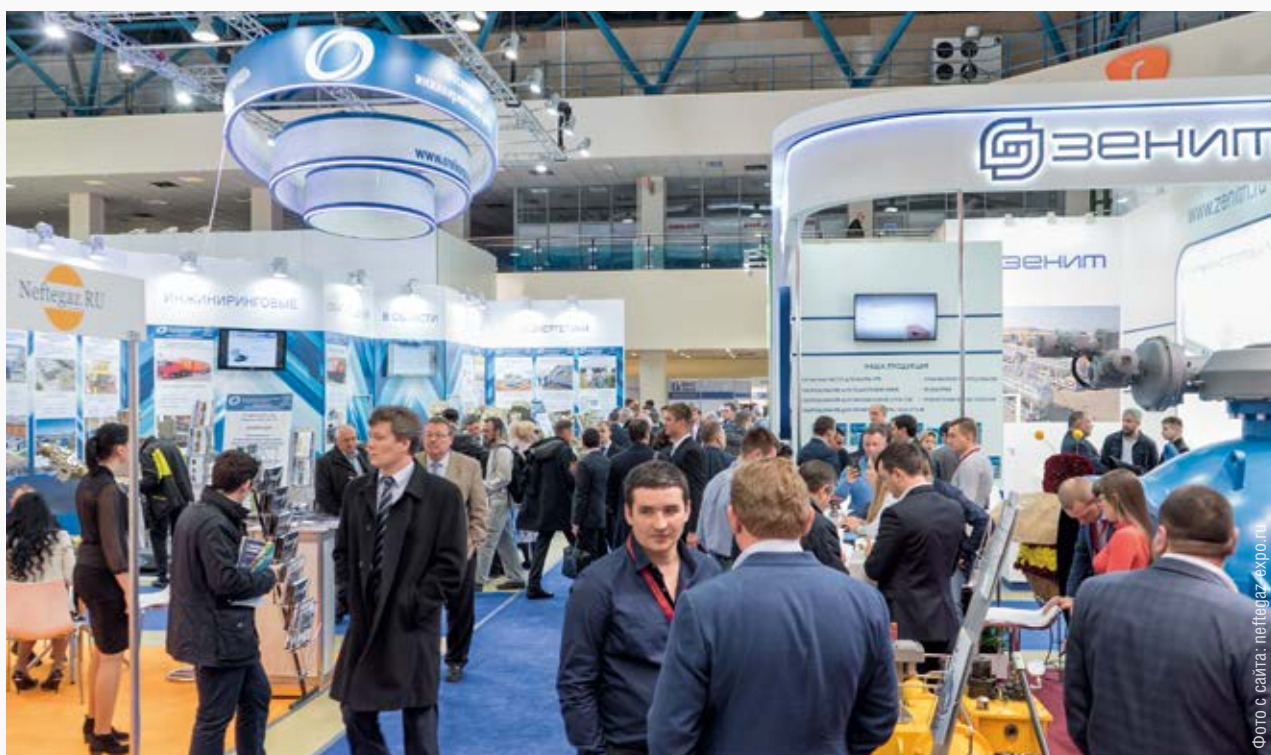
Экспоненты и посетители выставки «Нефтегаз-2017»