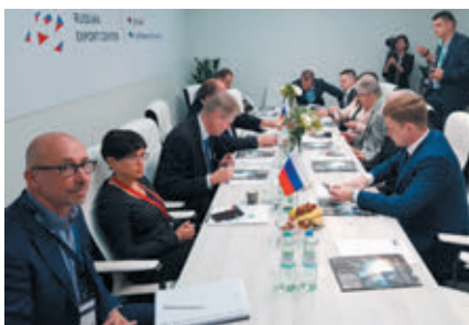
Участники российско-германского круглого стола

➤ В рамках международной выставки «АСНЕМА 2018» 11 июня 2018 года на стенде Российского Экспортного Центра состоялся российско-германский круглый стол, в котором приняли участие более 20 специалистов. Мероприятия было организовано ООО «Отраслевой ИАЦ НПАА» совместно с Российским союзом химиков.