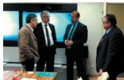
Участники рабочего совещания

Для компании «Газпром газомоторное топливо», управляющей комплексами по сжижению природного газа в Петергофе и Калининградской области, а также осущест-