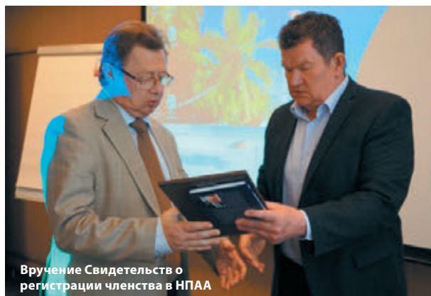
Вручение Свидетельств о регистрации членства в НПАА

➤ Началось заседание с приятного момента – обновления Свидетельств о регистрации членства в НПАА. Новые документы в торжественной обстановке получили следующие компании – ЧАО «Киевское ЦКБА», ООО «РТМТ», ЗАО «Курганспецарматура».