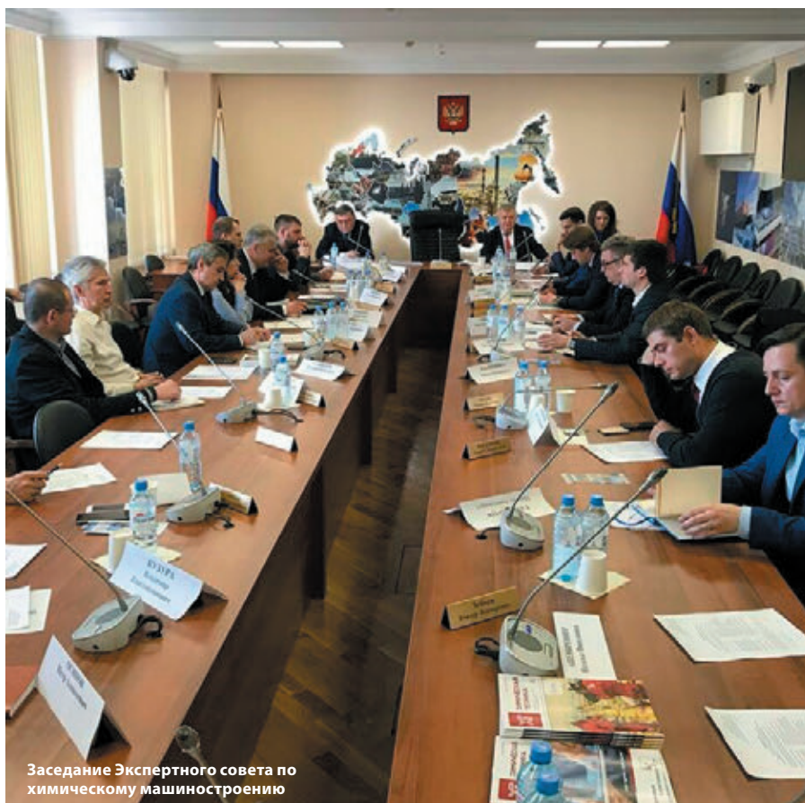
Заседание Экспертного совета по химическому машиностроению