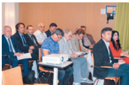
Участники Общего собрания