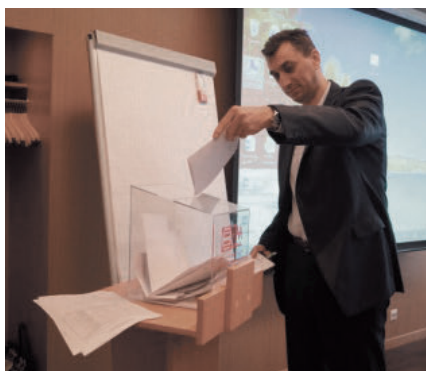
Процесс тайного голосования

в ее продвижении и развитии. Как говорится – «свежая кровь». Думаю, что члены НПАА сделали правильный выбор. А то, как будет проходить дальнейшее взаимодействие и каких новых рубежей нам удастся достигнуть в результате совместной работы, конечно же, покажет время».