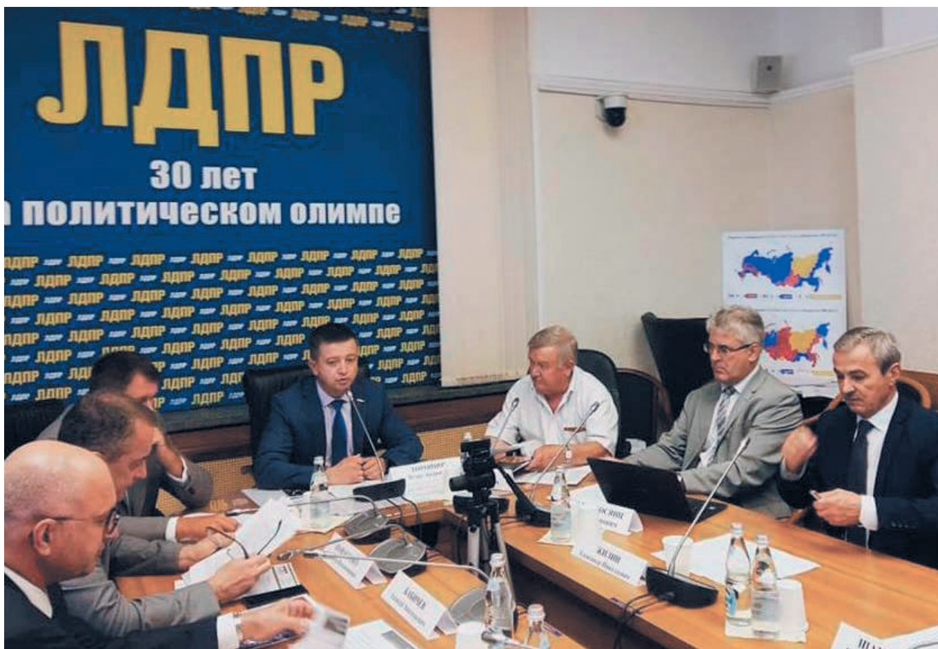
Участники заседания в Госдуме

➤ В Государственной Думе РФ 20 июня 2018 состоялось заседание Экспертного совета по химическому машиностроению при Комитете по экономической политике, промышленности, инновационному развитию и предпринимательству Государственной Думы РФ по проблемным вопросам производственной и экономической ситуации в арматуростроении.