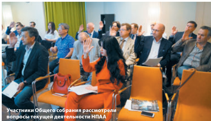
Участники Общего собрания рассмотрели вопросы текущей деятельности НПАА