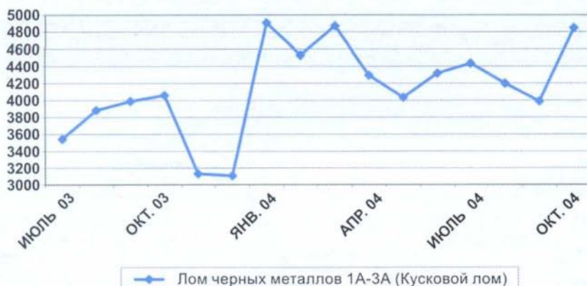
Рис. 4. Средние цены на лом цветных металлов (руб./т, вкл. НДС)