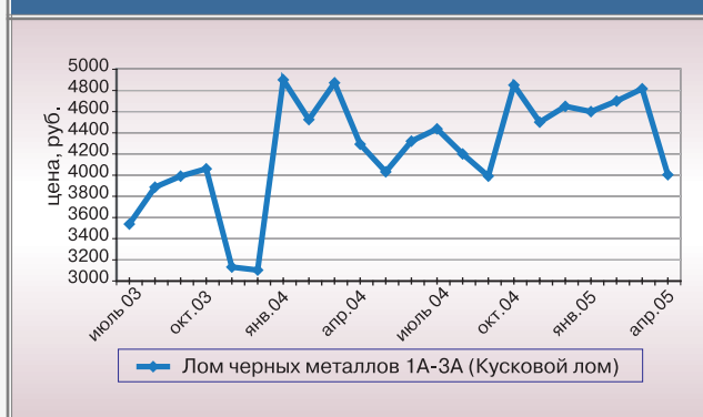
Рис. 3. Средние цены на лом черных металлов

на весенний рост цен. Очевидно, в рыночную ситуацию вмешались новые, не учтенные ранее факторы. Увеличение спроса на фоне сокращения предложения и привело к взлету цен в 2004 году. Как считают российские аналитики, мнение которых привело на прошлой неделе агентство «Прайм-ТАСС», во второй половине текущего года рынок металлолома успокоится, а колебания цен несколько сгладятся. Одной из причин стабилизации при этом будет резкое снижение темпов роста сборов металлолома. Например, если в прошлом году в России было собрано 28,8 млн тонн вторсырья – на 30% больше, чем годом ранее, а российский экспорт увеличился