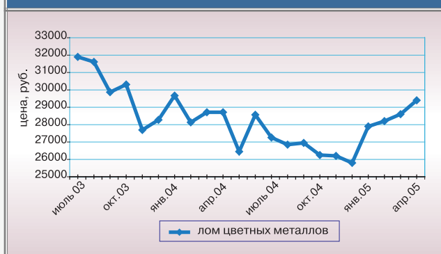
Рис. 4. Средние цены на лом цветных металлов

сразу на 67%, то в 2005 г. оба показателя подрастут не более чем на 2-5%. Таким образом, наибольшее повышение цен пришлось на прошлый, 2004 год. В перспективе же цены на лом, дойдя до определенного предела в своем понижении, снова пойдут на повышение, когда потребители используют накопившиеся запасы.