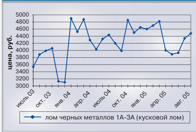
Рис. 3. Средние цены на лом черных металлов

стили сборы металлолома. Только в России было накоплено около 28 млн тонн лома, почти на треть больше, чем год назад, а зарубежным покупателям было поставлено сразу 13,5 млн тонн – на 60% больше, чем в 2003 году. Зимой и в начале весны этого года большинство экспортеров сдерживали поставки, в надежде на сезонное повышение цен в конце первого – начале второго кварталов. Однако, запасы были еще велики, твердая позиция потребителей, сбивающих цены, в конце концов, спровоцировала волну продаж, в ходе которых цены за май-июнь опустились более чем на 25%. К концу июня – началу июля пришло время закупать материалы на третий квартал и цены вновь стали повышаться. В результате, несмотря на снижение объемов производства и стоимости стальной продукции цены на лом предположительно останутся на нынешнем уровне. На рисунке 3 приведен график изменения рыночных цен на металлолом.