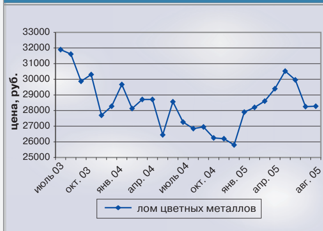
Рис. 4. Средние цены на лом цветных металлов

В табл. 1 и рисунках с 1 по 4-й показано изменение российских цен на сырье и материалы, являющихся ценообразующими для арматуростроения, с октября 2004 г. по август 2005 г. Для анализа цен использовались данные следующих предприятий: