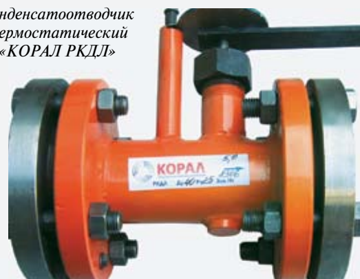
Конденсатоотводчик термостатический «КОРАЛ РКДЛ»