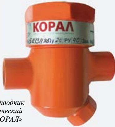
Конденсатоотводчик термодинамический «45с13нж - КОРАЛ»

Существует также такое понятие как комбинированные КО, которые не являются самостоятельной группой. Они проявляют себя как сложные гидравлические сопротивления при последовательном или параллельном соединении рассмотренных отводчиков или поочередном включении их в работу с соответствующей деформацией расходной характеристики. В принципе, при разработке конструкций комбинированных КО возможно сочетание их преимуществ и исключение недостатков. 1