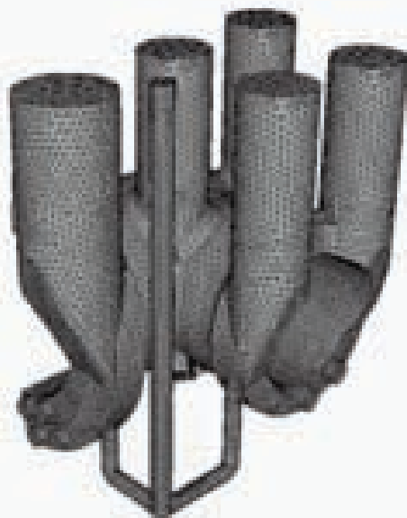
Рис. 1. Расчетная сетка в отливке

В процессе расчета пользователь может просмотреть результаты заполнения формы, определить места высокой турбулентности, возможные места размыва формы; оценить характер кристаллизации отливки; выявить тепловые узлы в отливке и предпринять соответствующие меры для устранения дефектов. Также пользователю доступны для просмотра поля температур, скоростей, давления потока, количества твердой фракции и многое другое.