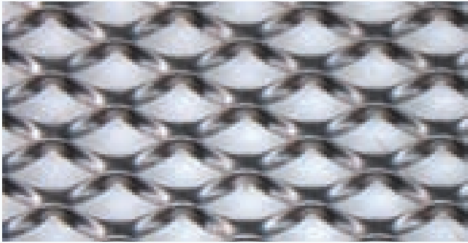
Рис. 2. Просечно-вытяжная сталь

Дополнительное металлическое армирование вносит значительный вклад в прочность прокладочного материала из слюды, и, кроме того, существенно улучшает герметичность материала благодаря образованию ячейками замкнутых контуров.