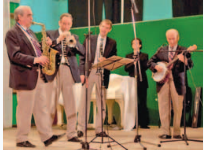
Джазовый концерт в честь Юбилея

Заместитель Министра промышленности и торговли Российской Федерации А.В. Дементьев