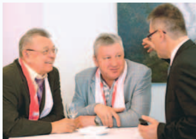
В перерывах между поздравлениями