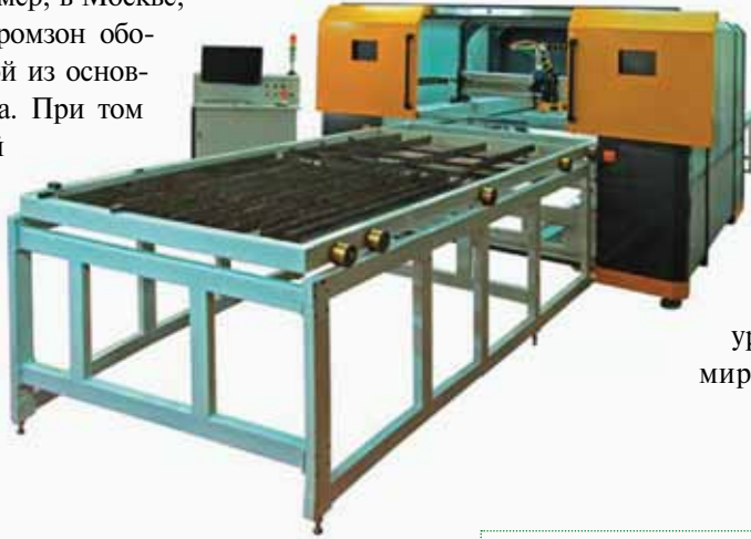
Рис. 2. Лазерная система МЛПЗ компании ЗАО «НИИ «ЭСТО» (Россия) с высокоэффективными линейными двигателями НПЦ «Лазеры и аппаратура ТМ» (Россия) и волоконными лазерами «Ирз-полюс» (Россия)

Эта проблема особенно остро ощущается в больших городах, например, в Москве, где реструктуризация промзон обозначена в качестве одной из основных задач правительства. При том или ином решении этой проблемы комплексный подход к обеспечению энергоэффективности и гибкости технологического цикла будет иметь приоритетное значение. Ведь в большом городе низкая энергоэффективность автоматически влечет за собой целый клубок сопутствующих проблем: низкая конкурентоспособность компаний приведет к падению занятости, лишней расход энергии и сырья усугубит транспортные и экологические проблемы.